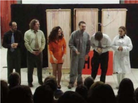
Grupo de actores de la ACHS, al finalizar la obra de teatro “Prevención de Riesgos en la Historia”.