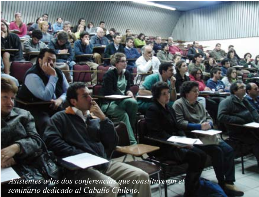
Asistentes a las dos conferencias que constituyeron el seminario dedicado al Caballo Chileno.